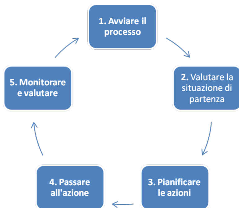
Diagramma 1. Le fasi chiave di un approccio scolastico globale per diventare e/o rimanere una scuola che promuove salute.

La Comunicazione e la Valutazione sono due componenti di questo processo su cui è utile riflettere e lavorare in ciascuna fase.